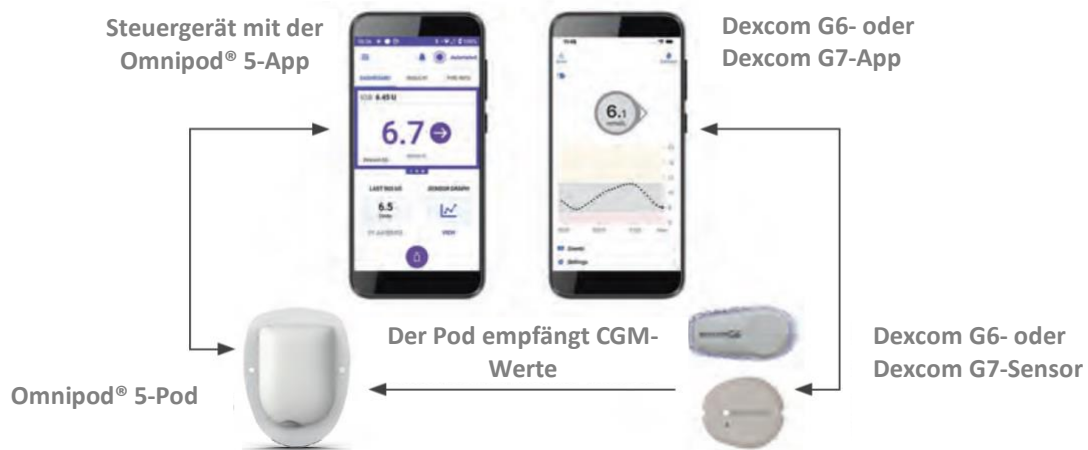
Abbildung 1 (unten) zeigt das Omnipod 5-System mit dem interoperablen Dexcom Sensor.

Die Verwendung eines kompatiblen Systems zur kontinuierlichen Glukosemessung (CGM) ist Voraussetzung für die Nutzung des Omnipod 5-Systems im Automatisierten Modus.